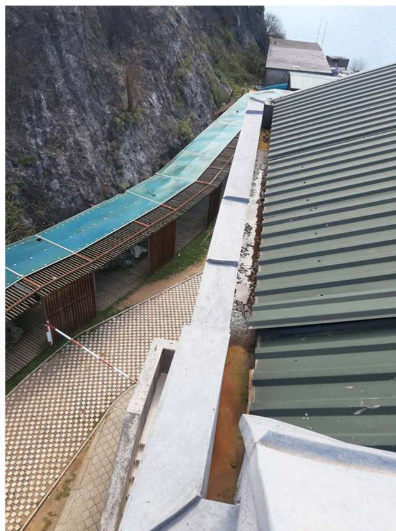
6 Oštećenja oluka i krovnog pokrivača