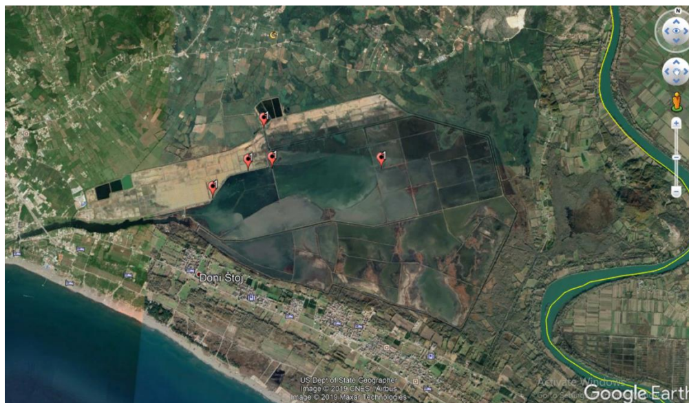
Slika 1. Kartografski prikaz rasprostranjenja vidre ( Lutra lutra )

Kao najpogodniju metodu istraživanja vidre odabrana je neinvazivna metoda direktnog osmatranja tj. prikupljanja podataka o znakovima prisutnosti vidri kao što su otisci šapa, izmet i druge izlučevine, pronalazak jazbina i drugih tragova. Na taj se način dobiju kvalitetni podaci o rasprostranjenosti vrste na određenom području. Vidre najčešće izmetom označavaju mjesta gdje ulaze u vodu, potom ušća manjih vodotoka u veće, nasuto kamenje uz obalu ili na različitim bentonskim strukturama uz vodu. Važno je napomenuti da se vidrini brlozi i skloništa rijetko nalaze, jer su dobro zaklonjena, a u njihovoj blizini nalazi velika količina izmeta.