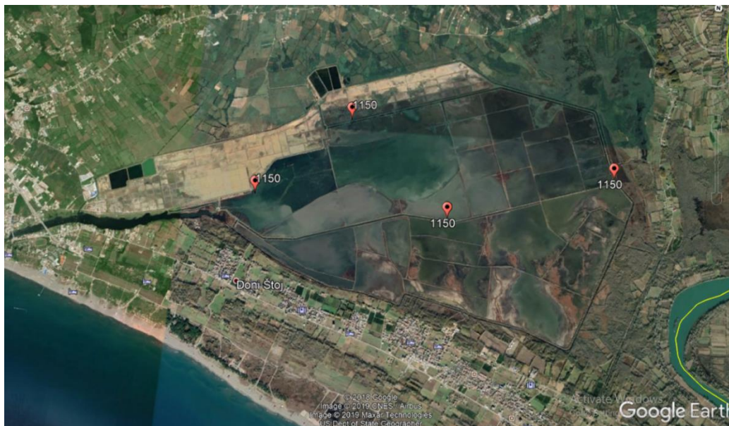
Slika 4. Kartografski prikaz rasprostranjenja habitat 1150 *Morske lagune na prostoru Ulcinjske solane

Ovaj tip habitata na području solane nalazimo u vidu plitkih, obalnih slanih voda različitog saliniteta i količine sa prisustvom vegetacije iz Ruppiaetea maritima . Ovaj tip se klasifikuje kao prioritetni tip staništa za zaštitu prema Aneksu I Direktive o staništima. U lagune se ubrajaju slabo korišćeni slani bazeni i slane bare koje su vještački nastale promijenjenoj prirodnoj laguni.