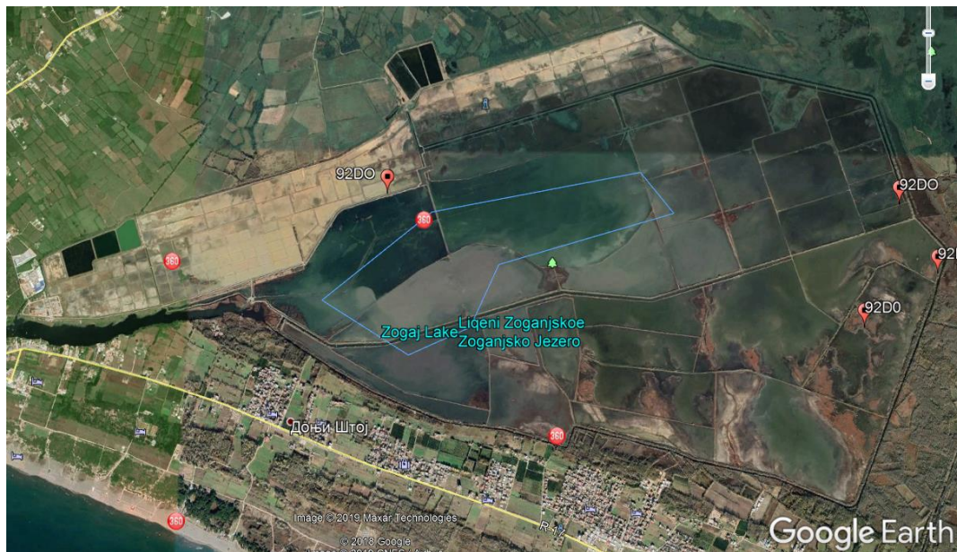
Slika 5. Kartografski prikaz rasprostranjenja habitat 92do na području Ulcinjske solane

Ovaj tip habitat obuhvata šumarke Tamarix-a uz obalu jezera, te travnate zajednice koje su pod uticajem slatke, brakične ili slane vode.