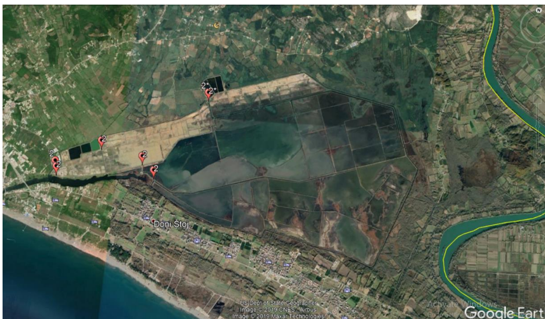
Slika3. kartografski prikaz rasprostranjenja šišmiša ( Chiroptera ) na prostoru Ulcinjske solane (2- nije potvrđeno prisustvo; 2*- potvrđeno prisustvo šišmiša)

U cilju utvrđivanja prisustva šišmiša na prostoru Solane ultrazvučnom detekcijom su obrađena najkarakterističnija staništa šišmiša (napušteni objekti i napuštena fabrika proizvodnje soli). Prisustvo je potvrđeno na stanici 31 i to predstavnicima dvije vrste iz roda Rhinolophus ( R. Ferrumequinum i R. hipposideros ). Obzirom da su šišmiši posjeduju različite stepene zaštite mnogim međunarodnim konvencijama (UNDP konvencija, Habitat direktiva I NATURA 2000, Bernska i Bonska konvencija) predlažemo da se u idućoj godini nastavi monitoring šišmiša na ovom prostoru.