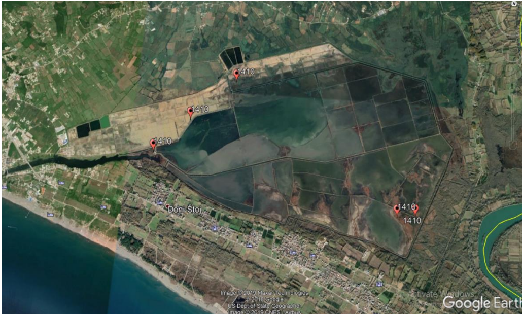
Slika 2. Kartografski prikaz rasprostranjenj habitat (1410) Mediteranske slane močvarne livade ( Juncetalia maritima ) na prostoru Ulcinjske solane

Na istraživanom području ovaj habitat je evidentiran na: