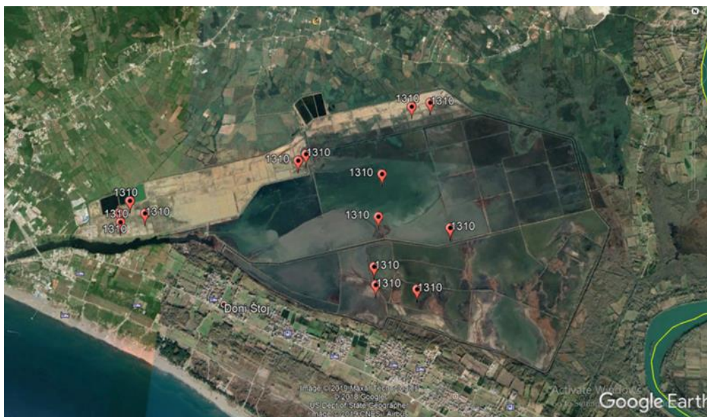
Slika 1. Kartografski prikaz rasprostranjenja habitata (1310) Jednogodišnja vegetacija caklenjača u mulju i pijesku na prostoru Ulcinjske solane (prema Google earth)

Ovaj habitat obuhvata vegetaciju koja je izgrađena uglavnom od jednogodišnjih biljaka, koju prije svega čine predstavnici familija Chenopodiaceae ( Salicornia ) i Poaceae , a koja naseljava periodično plavlvenu, muljevitu i pjeskovitu podlogu. Ovaj tip habitata pored Ulcinjske solane, takođe je rasprostranjen i na prostoru Tivatskih solila.