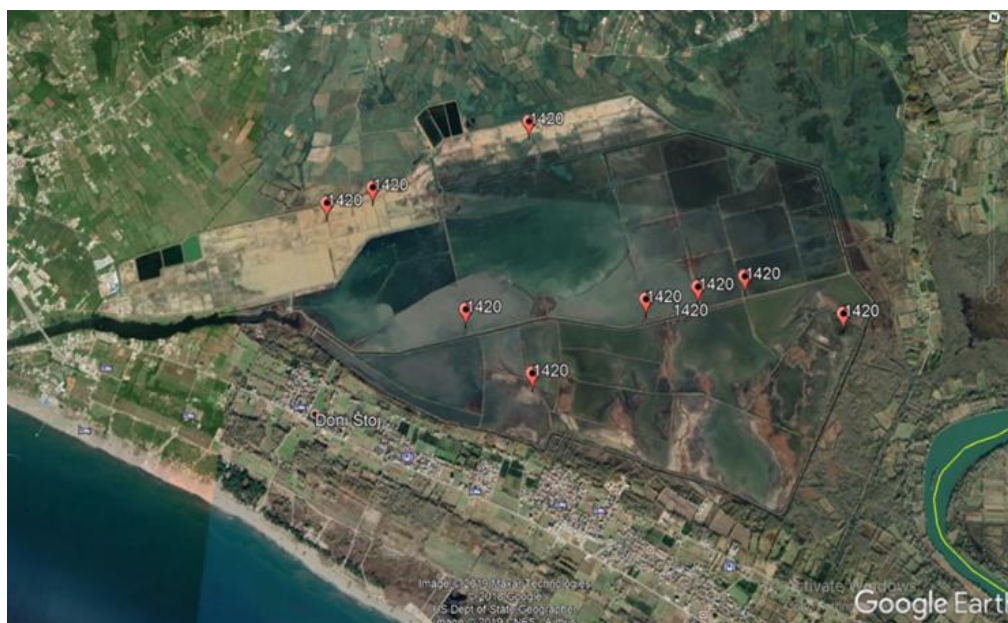
Slika 3. Kartografski prikaz rasprostranjenja habitata (1420) Mediteranske i termo-atlanske halofitne zajednice žbunaste caklenjače ( Sarcocornetea fruticosi ) na Ulcinjskoj solani

jedan na drugi. Zajednice sa žbunastom caklenjačom su u zavisnosti od ekoloških karakteristika samog staništa (plavljenje, zaslanjenost podloge) izdiferencirane na suvlju i vlažnu varijantu. Kada je u pitanju suvlja varijanta tu se žbunasta caklenjača javlja na izdignutijim mjestima, van domašaja plime, dok se vlažna varijanta javlja u uslovima plavljenja i velike zaslanjenosti podloge. U oba slučaja ona je najdominantnija, s tim što u vlažnijoj varijanti ima veću brojnost i pokrovnost.