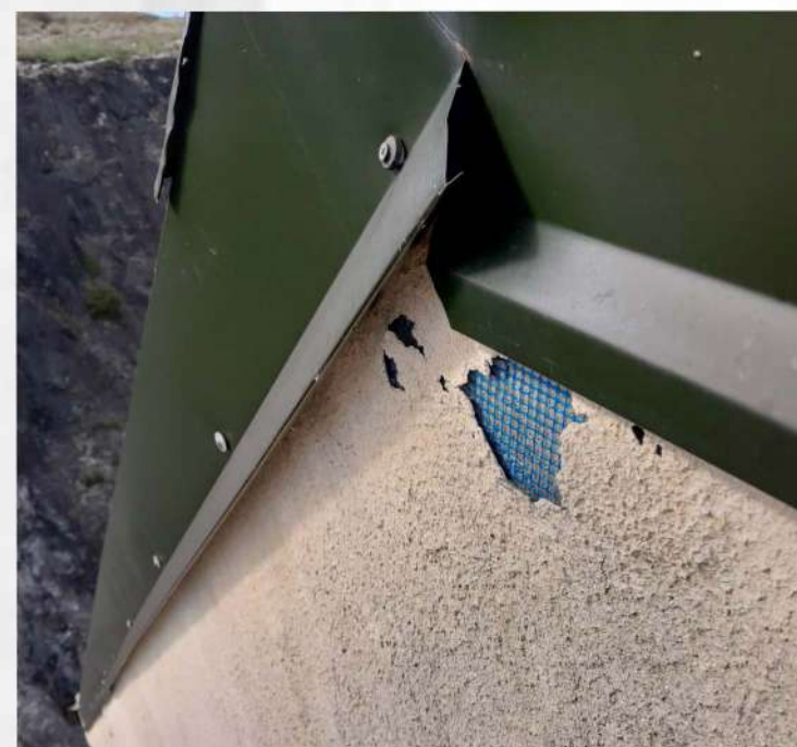
OŠTEĆENJA FASADE OBJEKTA