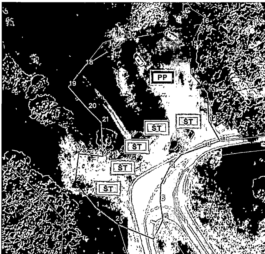
Prelomne tačke lokacije br. 14 sa koordinatama