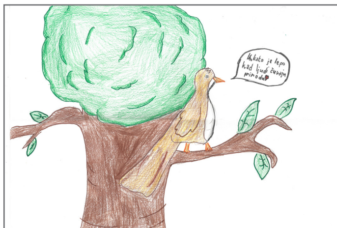
Olga je nacrtala koliko je priroda važna za sva živa bića.