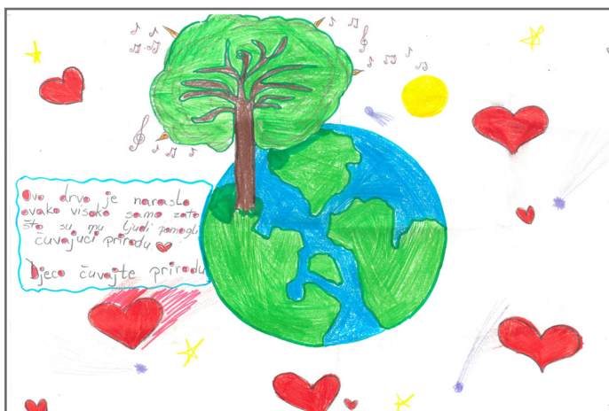
Stefanija poručuje da čuvamo planetu.