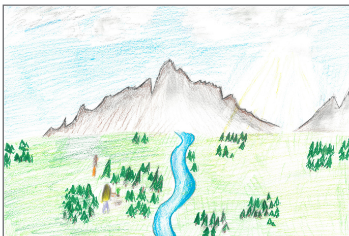
Ivana je crtežom prikazala koliko je važno učestvovati u pošumljavanju okoline.