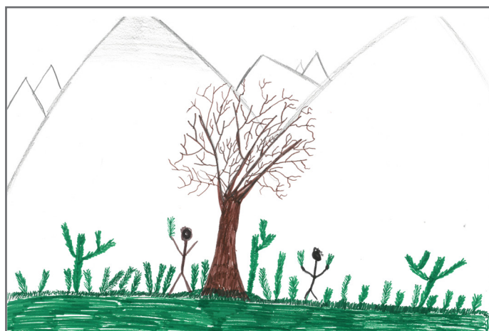
Ljepotu očuvane prirode crtežom je prikazao Pavle. Svaki čovjek ima pravo na zdravu životnu sredinu.